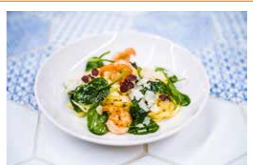
× PASTA LIMONI ×